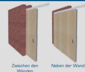
Zwischen den Wänden Neben der Wand

Prüfzeugnisse auf Anfrage erhältlich. Abweichende Produktausführungen und Maße auf Anfrage. Für weitere technische Informationen wenden Sie sich bitte an Ihren Parthos Vertreter. * Konstruktion gemäß getesteter Palace 110S Ausführung.