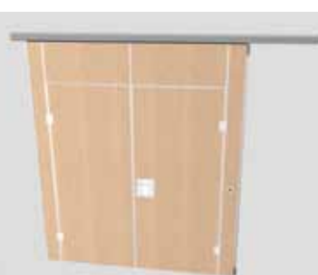
Element mit zweiflügeliger Durchgangstür