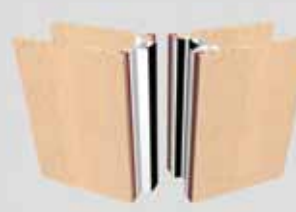
Palace 110SI EI60 mit innenliegenden Profilen