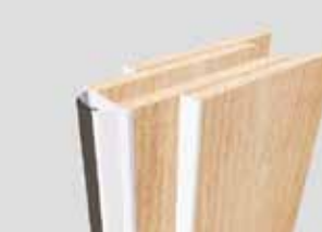
Teleskop mit Kantenschutzprofil