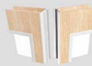
Transpalace 80 mit Einfachverglasung / geeignet für den Außenbereich