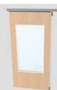
Element mit Glasausschnitt