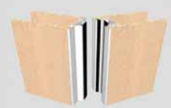
Palace 110 S