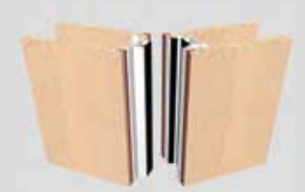
Palace 110SI EI30 mit innenliegenden Profilen