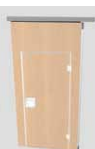
Element mit einflügeliger Durchgangstür